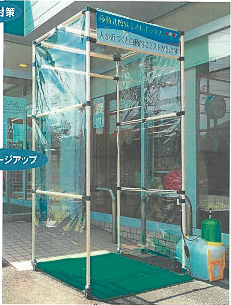
※写真はウォークスルータイプです。ウォークインタイプ(出入口1ヵ所)の生産も可能です。 ※写真の吸水マットは付属していません。